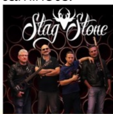
STAG STONE La Régalade