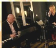
JAZZ AFTER EIGHT Brasserie Thiriez