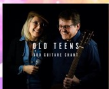
OLD TEENS Au Bon Coin