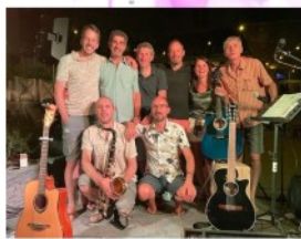
LES COCOS DU JEUDI Camping des Roses