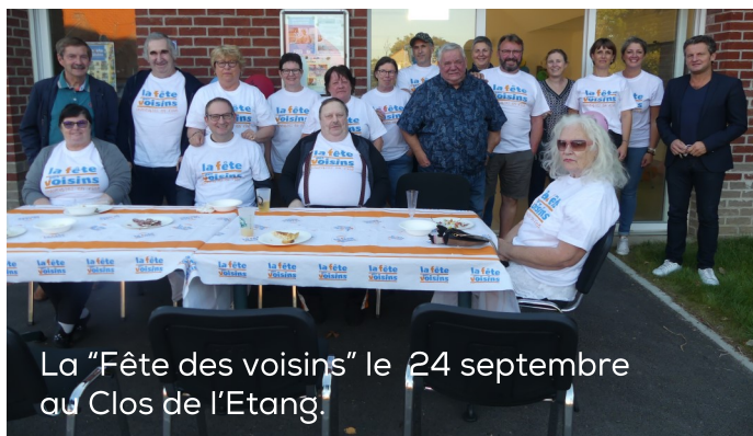
La "Fête des voisins" le 24 septembre au Clos de l'Étang.