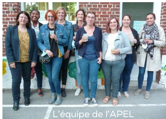
L'équipe de l'APEL

Si vous connaissez des familles qui recherchent une école familiale, dynamique, avec un beau projet pour l'environnement et l'initiation au Flamand, n'hésitez pas, l'école Saint Joseph saura les accueillir. Retrouvez-nous dès le mois de novembre au Marché de Noël.