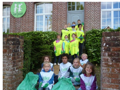
Nettoyons la nature

Pour aider tous ces projets à se mettre en place, La nouvelle équipe de l'APEL prévoit de nombreuses actions qui seront présentées sur notre nouveau facebook « Apel St Joseph Esquelbecq ».