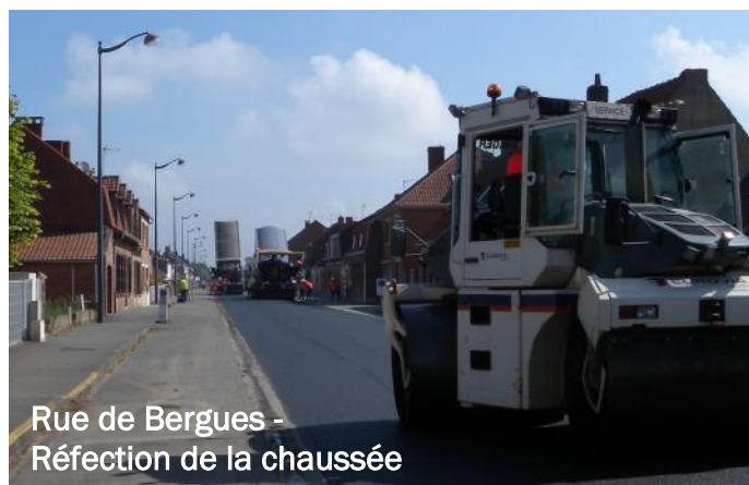
Rue de Bergues - Réfection de la chaussée