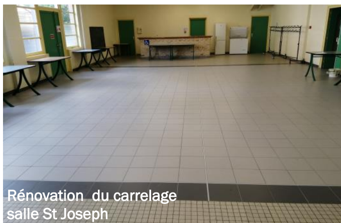
Rénovation du carrelage salle St Joseph