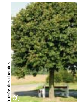
Croisée des chemins

Liste et infos sur : www.tourisme-nord.fr