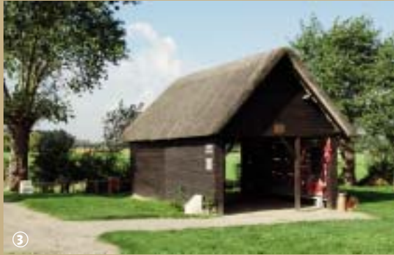
Réplique de la grange

Le 28 mai 1940, alors que les combats faisaient rage, les Allemands attaquent le nœud routier de Wormhout, point stratégique de leur progression vers Dunkerque, défendu avec acharnement par les Britanniques. Durant cet affrontement, une centaine de soldats anglais sont faits prisonniers, puis menés et enfermés dans une grange implantée sur une pâture au lieu-dit « la Plaine au Bois » à Esquelbecq. Ils sont alors assassinés par des membres du régiment SS d'Adolf Hitler, la garde personnelle du Führer, qui n'ont pas supporté que l'on puisse leur opposer une telle résistance. Cette exécution, ponctuée d'atrocités, est connue sous le nom de « massacre de Wormhout » bien qu'elle ait eu lieu en réalité sur la commune voisine d'Esquelbecq.